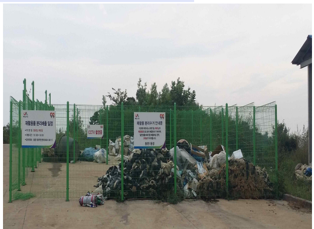
울타리 메쉬 방식