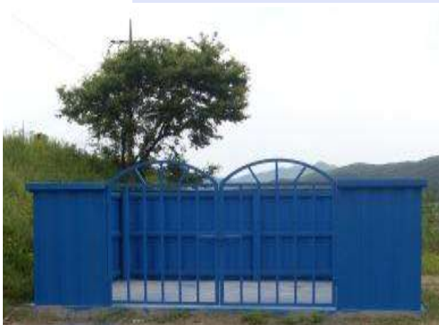
상부 개방형 컨테이너 방식